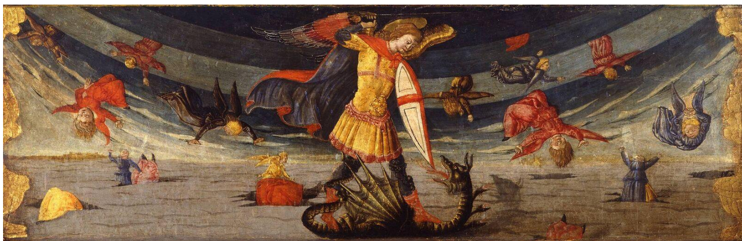
Neri di Bicci, 1480

самото Пришествие през 1933 г., както явно и след него през целия останал 20. век под формата на Втората световна война и последвалата я Студена война. Те затвърждават конфликта Изток – Запад и оформят по-добре двата противника на светско ниво в лицето преди всичко на САЩ и СССР. Във военен смисъл това е противоборството между НАТО и източноевропейските страни от Варшавския договор. По този начин не само Франция се явява духовен враг на Русия и Изтока като цяло, но и САЩ и Великобритания, представляващи Запада като цяло.