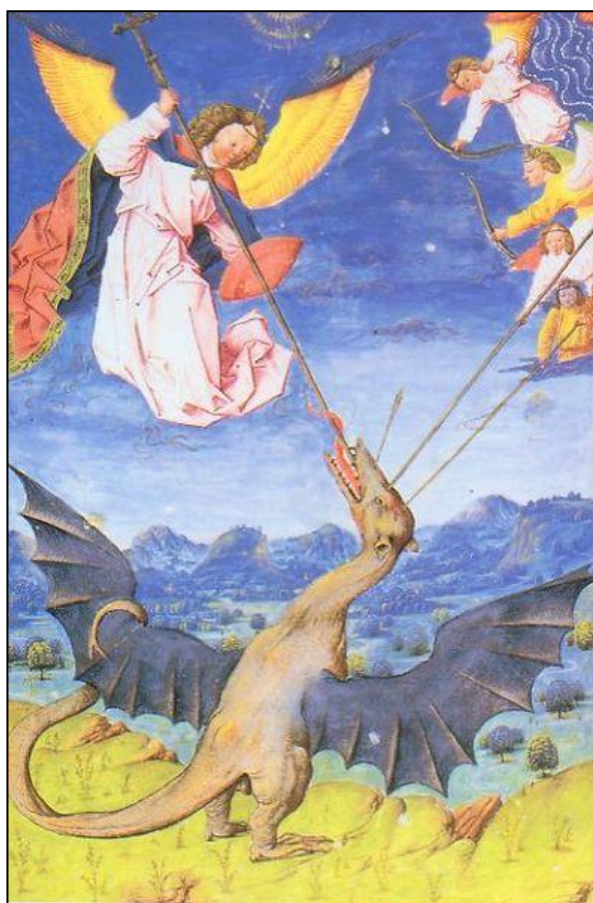
Wyvern_Liber_Floridus, 15 th century

«И так мы видим дух Михаила и в его окружении некоторое количество русских душ, сражающихся за чистоту духовного горизонта! Мы видим их в ожесточенной борьбе с душами, пришедшими с Запада и несущими в духовный мир сильно отпечатанные фантастические образы».